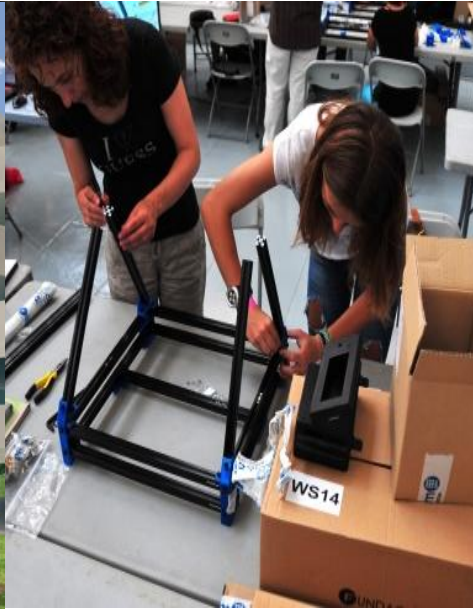
Ateneos de Fabricación Barcelona