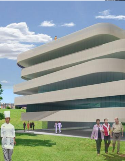
Basque Culinary Center San Sebastián