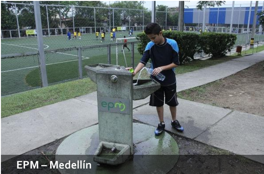
EPM – Medellín