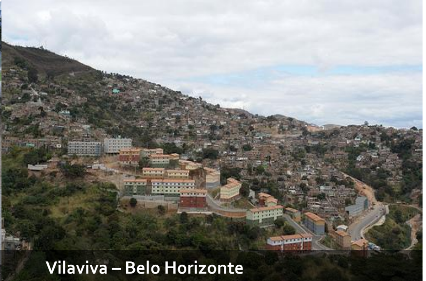
Vilaviva – Belo Horizonte