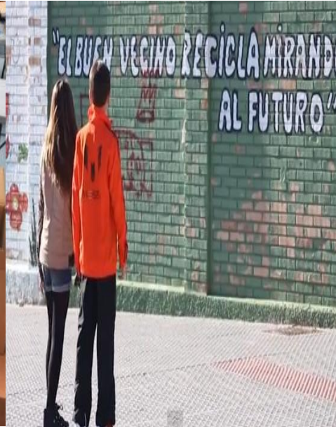
Proyecto Hogar Málaga