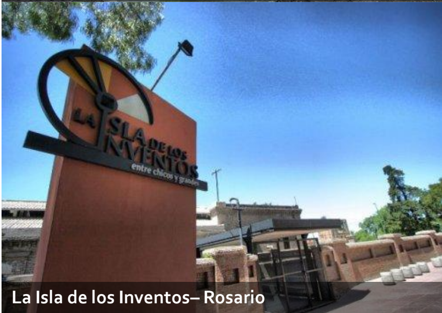
La Isla de los Inventos– Rosario