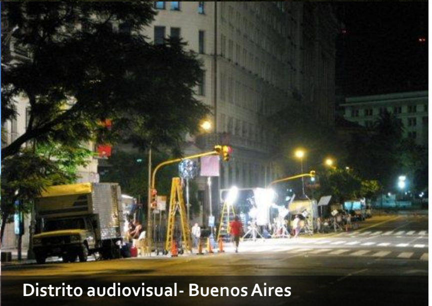
Distrito audiovisual- Buenos Aires