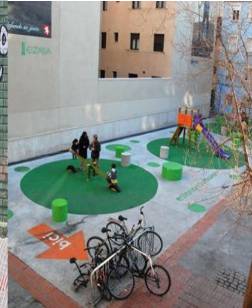
Esto no es un solar Zaragoza

Los proyectos estratégicos dan credibilidad al Plan Estratégico