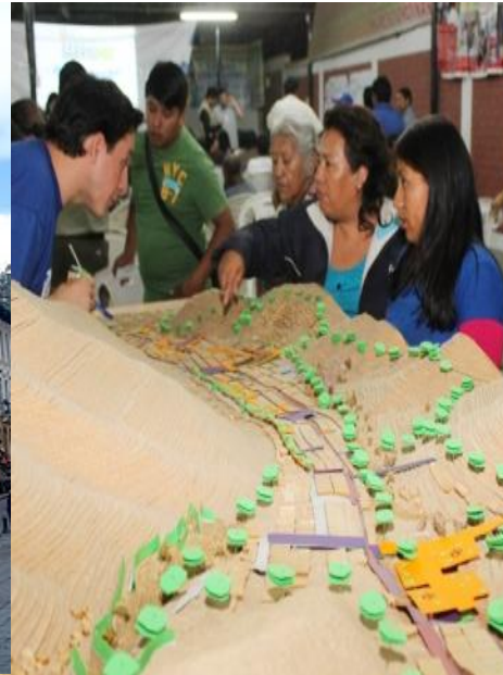
Barrio Mío Lima