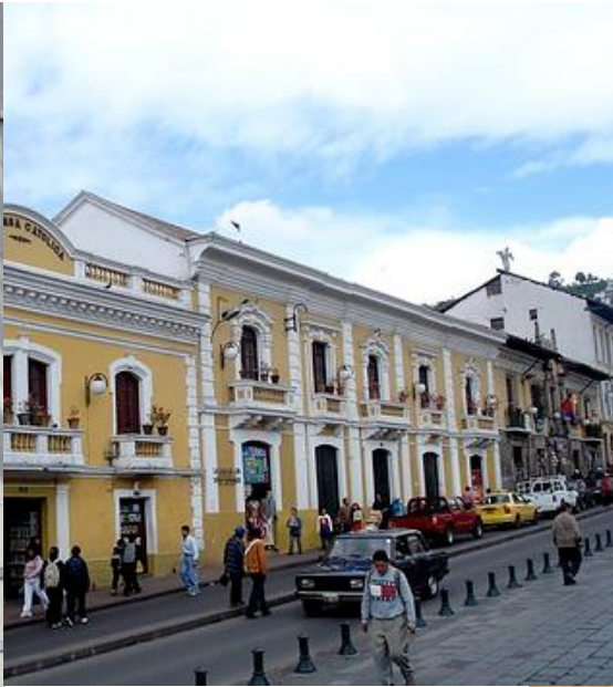
Centro Histórico Quito