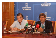
Marbella presentará una moción al pleno que exige que los promotores hagan frente a las cargas urbanísticas