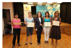
Marbella entrega los diplomas de las Jornadas sobre los Derechos de las Mujeres Extranjeras a 23 personas