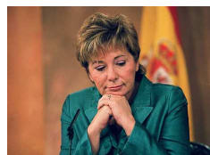
Villalobos: 'El capricho del PSOE es el único responsable de los retrasos en la hiperronda'