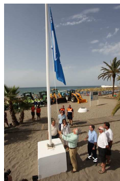
Marbella recibe cinco banderas azules para cuatro playas de la ciudad y del Puerto Pesquero La Bajadilla