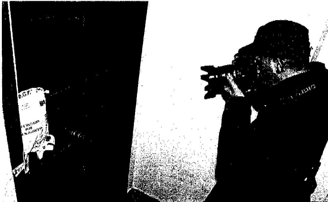
Un fotógrafo toma una imagen de la puerta de la vivienda, precintada por la Policía Nacional.

Los investigadores barajan la hipótesis de que la pareja se intoxicó por los gases emitidos ayer por una estufa de leña de la vivienda, aunque no se descartan otras causas