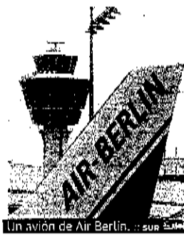
Un avión de Air Berlín.